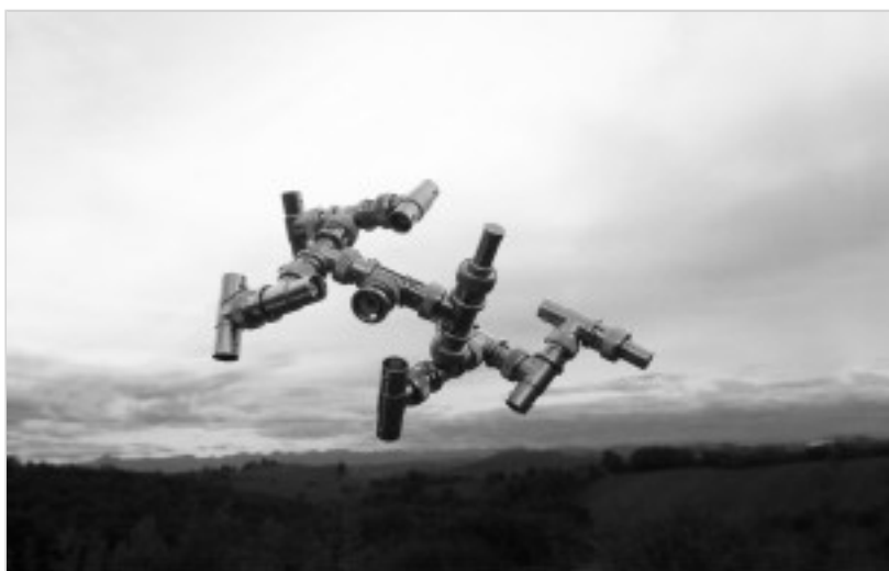
PASSAGE DE L'ISS (STATION SPATIALE INTERNATIONALE) - THOMAS PESQUET NOUS SALUE

Pour accéder à la galerie municipale, le pass sanitaire est obligatoire.