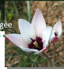
Tulipe de l'écluse, espèce protégée

Lové dans un méandre de l'Arize, ce village médiéval est labellisé parmi "Les Plus Beaux Détours de France".