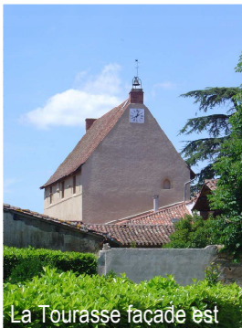
La Tourasse façade est

Au cœur de la ville-cité de Rieux-Volvestre, la Tourasse, patrimoine exceptionnel, attend de renaître à la vie.