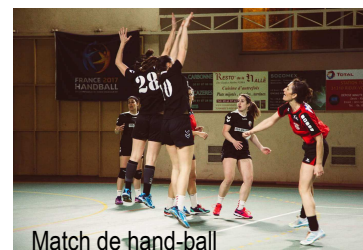
Match de hand-ball