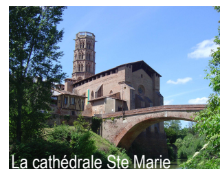
La cathédrale Ste Marie