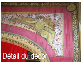
Détail du décor

Ce sera un lieu d'échanges culturels pour les associations, les scolaires, les habitants du sud toulousain toutes générations confondues.